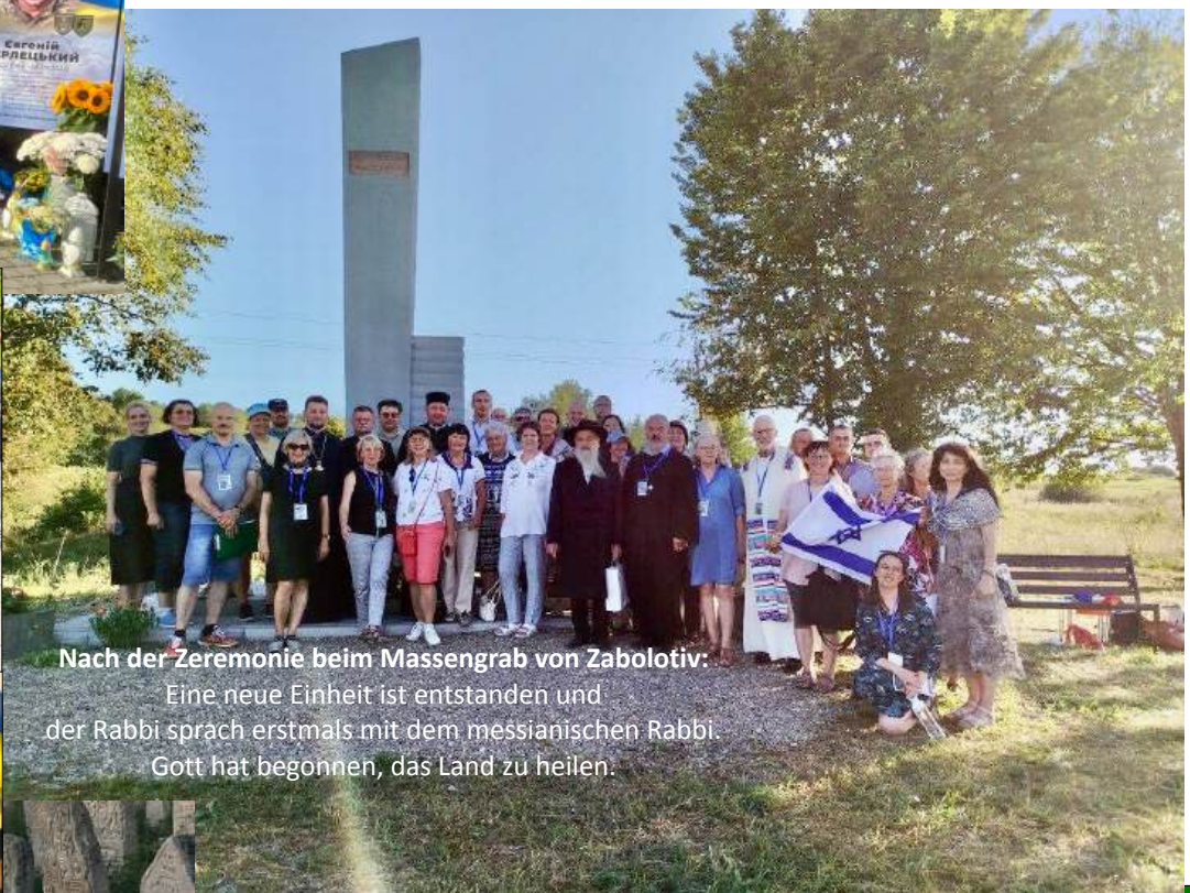
Nach der Zeremonie beim Massengrab von Zabolotiv: Eine neue Einheit ist entstanden und der Rabbi sprach erstmals mit dem messianischen Rabbi. Gott hat begonnen, das Land zu heilen.