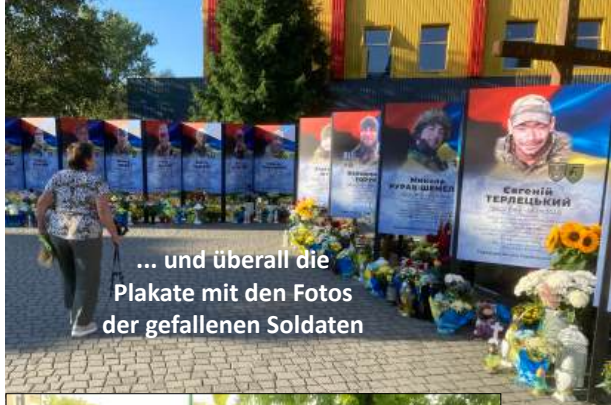
... und überall die Plakate mit den Fotos der gefallenen Soldaten

Es folgten Schuld- und Bussbekenntnisse von unseren Teilnehmern und im Namen ihrer Nationen. Dann kamen auch einheimische Verantwortliche aus christlichen Kirchen und messianische Juden, die Busse Taten, immer auch im Gedenken und verbunden mit dem ganzen Volk Israel, Gottes erst erwähltem Volk und sein Aугapfel. Nach dem priesterlichen Gebet zum Lamm Gottes, das die Sünde der Welt hinwegnimmt folgten Segensgebete für die Ukraine und Israel. – Alle lokalen Mitwirkenden, waren im Anschluss zum Dinner eingeladen. Neue Beziehungen entstanden.