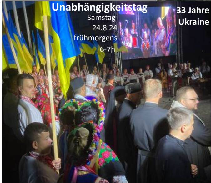
Unabhängigkeitstag Samstag 24.8.24 frühmorgens 6-7h 33 Jahre Ukraine