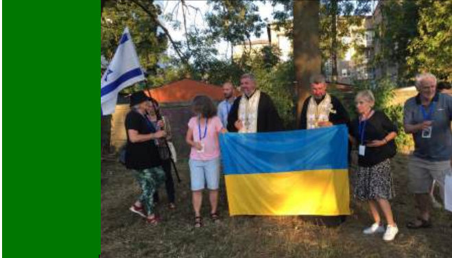
Wir baten die Rabbiner das Kaddisch und den aaronitischen Segen zu beten.