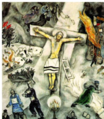
Marc Chagall: 'Weisse Kreuzigung', 1937, Art Institute of Chicago