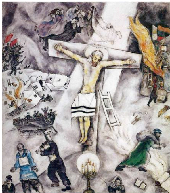
(E) The White Crucifixion (1938)

Er stirbt als „König der Juden“ (die Kreuzesinschrift klein auf Hebräisch). Er nahm das Leid der verfolgten Juden auf sich, wie es auf den umstehenden Szenen dargestellt ist. Abraham, Isaak und Jakob sowie Sarah schauen trauernd und ehrfurchtsvoll vom Himmel auf den Gekreuzigten. In der oberen rechten Ecke des Bildes raubt ein Nazi die Thorarollen, während die Synagoge abbrennt, eine direkte Anspielung an die Zerstörung der Synagogen in München und Nürnberg am 9. und 10. August 1938. Der Löwe über dem Synagogenportal bezeichnet den Stamm Juda, aus dem Jesus, der „Löwe aus dem Stamm Juda“ (Offb 5,5), abstammt. Unten links und rechts sieht man fliehende Juden. Einer trägt das Schild „Ich bin Jude“ auf der Brust, ein anderer sucht die Thorarolle, das Kostbarste der Juden, in Sicherheit zu bringen, wieder ein anderer trägt fliehend einen Sack mit seinen Habseligkeiten. Links suchen Juden umsonst auf einem Boot zu fliehen. Darüber brennt das Shtetl (jüdische Ansiedlung), auf das Nazihorden brandschatzend einstürmen. Zu Jesu Füßen brennt in einem Lichtkreis die Menora, der siebenarmige Leuchter, Zeichen der Gegenwart Gottes unter seinem Volk.